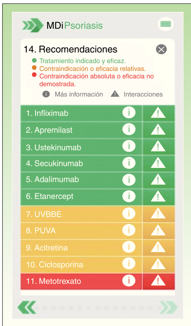
Figura 1 Pantalla de recomendaciones de MDi-Psoriasis ® correspondientes a la paciente descrita en el caso clínico n.º 5 (tabla 1).

ayuda al dermatólogo en la toma de decisiones terapéuticas en pacientes con psoriasis moderada-grave.