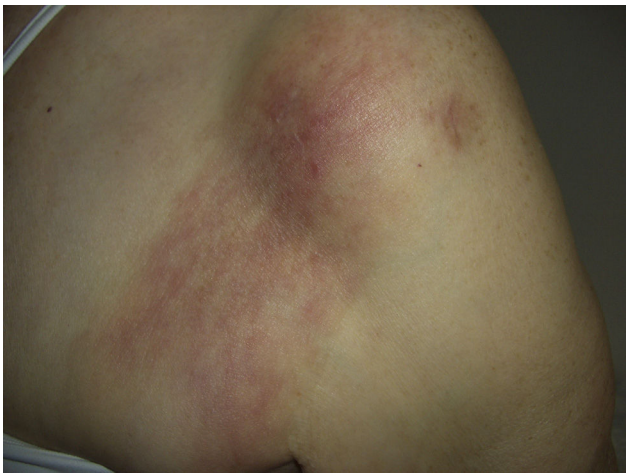
Figura 3 Segundo caso: placa eritematoedematosa de límites imprecisos en la superficie anterior del hombro izquierdo extendiéndose a la zona pectoral.

del tendón del bíceps) por una mancha eritematosa, asintomática, de aparición progresiva semanas después de la intervención (fig. 3). En tratamiento rehabilitador, había sido diagnosticada de dermatitis de contacto sin claro agente causal. Se había indicado tratamiento corticoideo tópico sin respuesta. A la exploración se observaba una