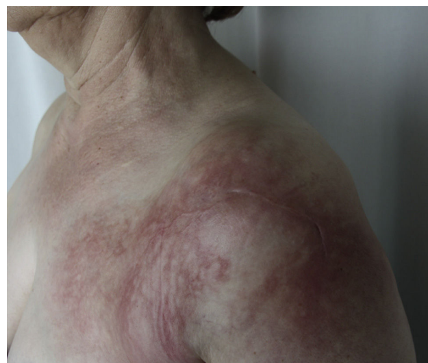
Figura 1 Primer caso: placa eritematoedematosa de aspecto livedoide, de límites mal delimitados, que ocupaba toda la región del hombro hasta el tercio proximal del deltoides.

El primer caso se trata de una mujer de 65 años, con el antecedente de una intervención quirúrgica para sutura del manguito de los rotadores del hombro izquierdo hacía un año. No tenía historia de artritis reumatoide ni de otras enfermedades. Consultó por una zona eritematosa en el hombro izquierdo de 2 meses de evolución, ligeramente pruriginosa, que no había respondido a distintas pautas de antibioterapia oral ante una primera sospecha de celulitis. En la exploración se apreciaba una placa eritematoedematosa de aspecto livedoide, de límites mal delimitados, que ocupaba toda la región del hombro hasta el tercio proximal del deltoides (fig. 1). La biopsia cutánea en sacabocados de 4 mm fue diagnóstica mediante la demostración de vasos dilatados en la dermis reticular que se teñían positivamente con CD31, CD34 y D2.40, y agregados de células intraluminales que marcaban positivamente para el CD68 (fig. 2).