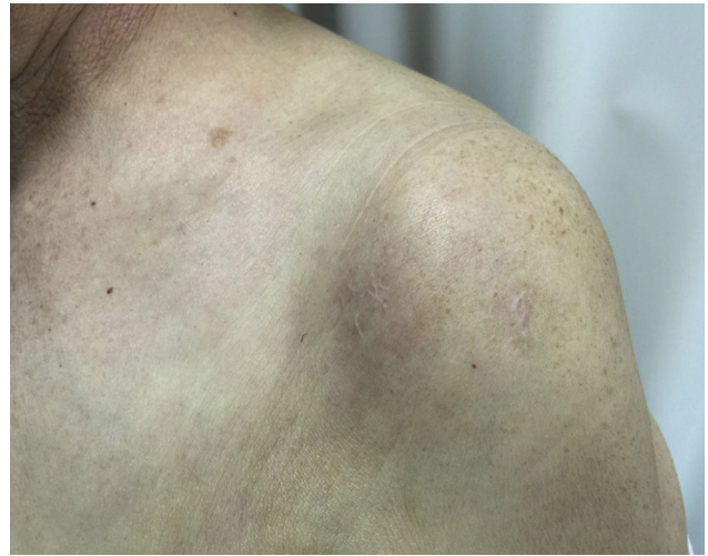
Figura 5 Resolución completa del cuadro tras el tratamiento con pentoxifilina oral y tacrolimus tópico.

placa eritematoedematosa de límites imprecisos en la superficie anterior del hombro izquierdo, extendiéndose a la zona pectoral. Con el diagnóstico clínico de sospecha de histiocitosis intralinfática se realizó una biopsia cutánea que mostró vasos dilatados en la dermis reticular positivos a CD31, CD34 y D2-40 (fig. 4), agregados de células CD 68+ en el interior de vasos linfáticos de la dermis reticular y celularidad inflamatoria linfocitaria perivascular, todo ello confirmando el diagnóstico. Se pautó tratamiento tópico con tacrolimus, una vez al día, y oral con pentoxifilina (400 mg al día), con excelente respuesta y práctica resolución a los 4 meses de tratamiento (fig. 5).