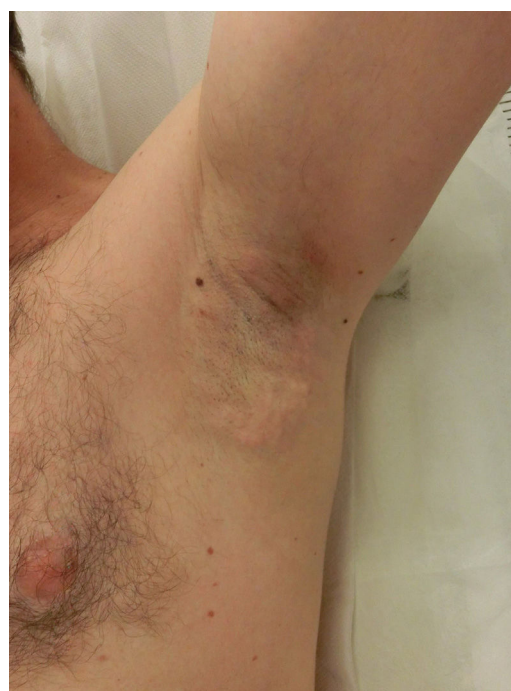
Figura 2 Inflamación local y nódulos subcutáneos postratamiento.

Prácticamente todos los pacientes experimentan inflamación local con dolor y presencia de nódulos subcutáneos que, de forma progresiva, desaparecen a lo largo de la