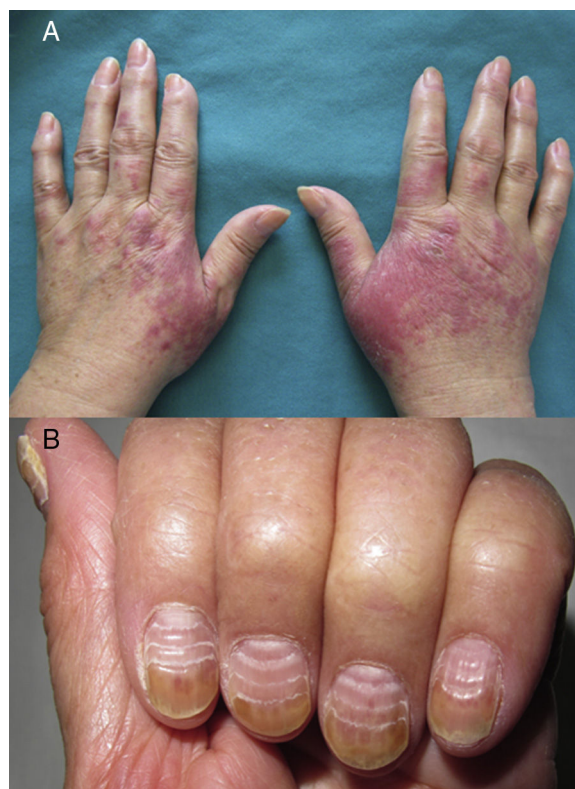
Figura 1 Síndrome PATEO: afectación cutánea y ungueal por docetaxel. A. Caso 1: placas eritematovioláceas en el dorso de las manos y en la falange proximal. B. Afectación ungueal en el caso n.º 3: líneas paralelas de Beau y onicolisis del tercio distal de la tabla ungueal.

Los 3 casos corresponden respectivamente a mujeres de 35, 56 y 68 años, con antecedentes personales de adenocarcinoma ductal infiltrante de mama, en tratamiento adyuvante con docetaxel y ciclofosfamida (tabla 1). Solicitaban valoración dermatológica por la aparición de placas eritemato-violáceas dolorosas y con descamación fina superficial en el dorso de ambas manos, que interferían con sus actividades de la vida diaria (fig. 1 A). En la anamnesis referían su aparición en un intervalo de 3 a 12 días