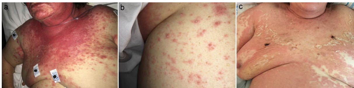
Figure 1 Clinical evolution. (a) Exanthema affecting mainly face, upper trunk, superior limbs with isolated patches on abdomen and lower extremities. (b) Closer image showing isolated pustules surrounded by erythema. (c) Evolution of the exanthema 5 days after Sorafenib discontinuation. Mild erythema and desquamation on upper trunk with pustules resolution.

Laboratory examination revealed a hypereosinophilia of 1.4 \times 10^9/L . A skin biopsy was performed, rendering typical histological features of AGEP (Fig. 2). Attending to the validated EuroSCAR scoring system, 2 our case was then classified as a Probable AGEP. Sorafenib was discontinued immediately, and treatment with intravenous methylprednisolone 1 mg/kg was initiated. Cutaneous lesions improved