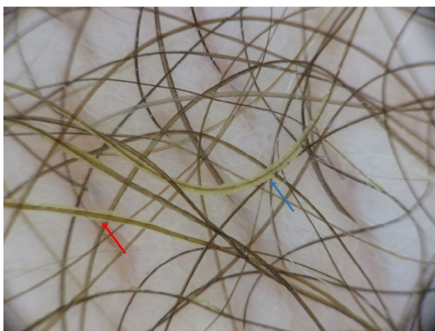
Figura 2 Dermatoscopia: Masas grumosas alrededor del pelo. Signo de la pluma (flecha roja) y signo de la brocheta (flecha azul).

Existen 3 formas de presentación clínica de la tricomicosis: flava, rubra y nigra. La tricomicosis flava es la más frecuente, y se caracteriza por la presencia de vainas mucoides malolientes adheridas al tallo piloso que forman nódulos de color blanco-amarillento, espesos e irregulares, que pueden llegar a cubrir todo el pelo. La raíz y la piel adyacente suelen estar respetadas. La composición química de esta sustancia aún no está aclarada, aunque se piensa que se origina por el metabolismo de las bacterias en las glándulas apocrinas 1-3 .