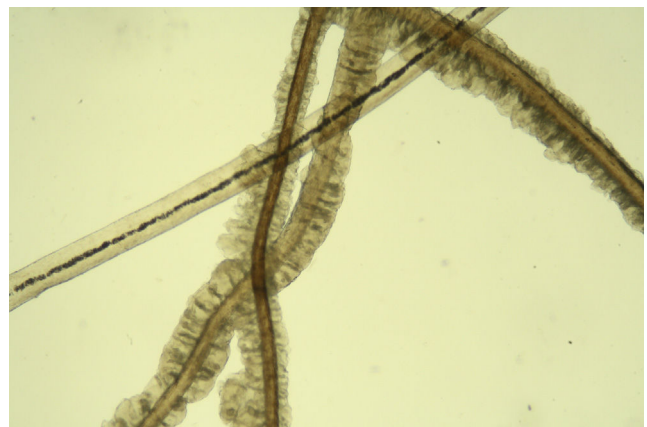
Figura 3 Tinción KOH: vainas mucoides alrededor del pelo (40x).

Los diagnósticos diferenciales principales son la tricorrexis nodosa, el monilétrix, el pseudomonilétrix, la tricorrexis