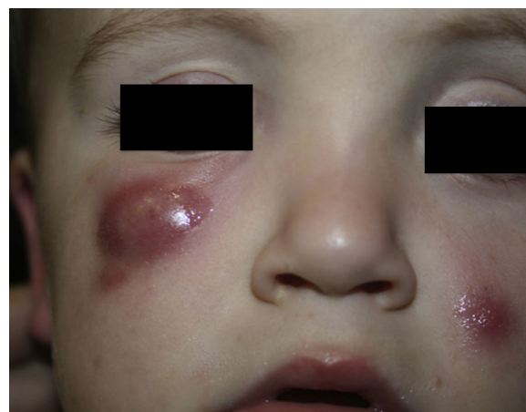
Figura 1 Nódulos eritematovioláceos asintomáticos en párpado inferior derecho y en mejilla izquierda.

Los padres no referían sangrado, ulceración ni emisión de líquido purulento. Negaban picadura o traumatismo previo. En otro centro se habían realizado cultivos para bacterias, hongos y micobacterias, que fueron negativos, y se había