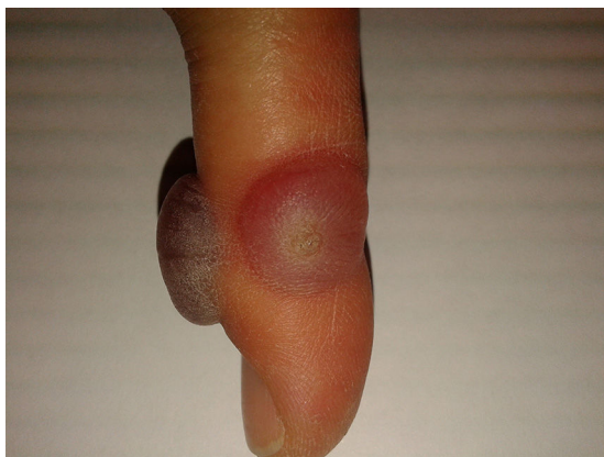
Figura 2 Ampollas hemorrágicas tras el tratamiento con crioterapia de 2 verrugas localizadas en el lateral y en el dorso de un dedo de la mano respectivamente.