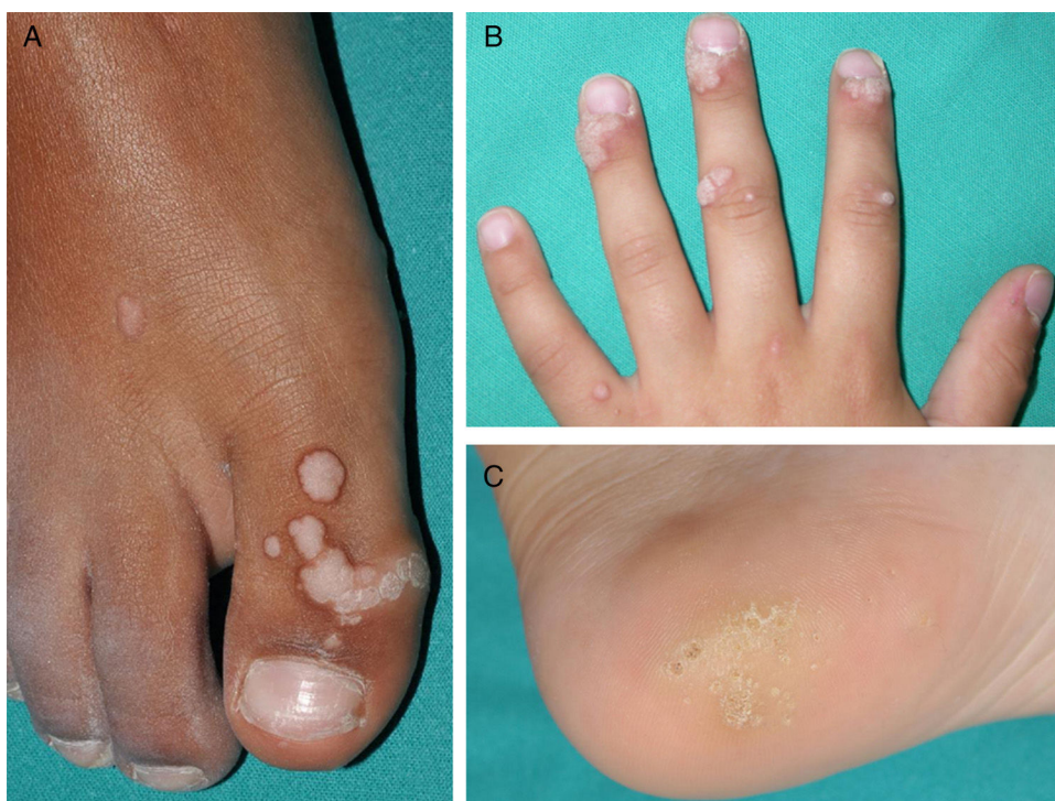
Figura 1 Verrugas vulgares de distinta morfología y localización en pacientes pediátricos. El número de lesiones en el dorso del dedo del pie (A) la localización periungueal de las mismas (B) o el tamaño de las localizadas en el talón (C) condicionarán el tipo de tratamiento elegido.