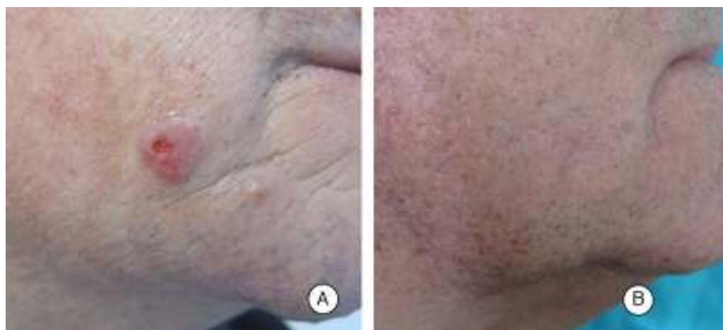
Figura 1 A) Lesión nodular bien delimitada en la mejilla derecha, eritematosa, con superficie parcialmente erosionada. B) Resolución completa de la lesión a las 4 semanas, con zona cicatricial correspondiente al punto de la biopsia.

Diferentes estudios han evaluado la expresión de los marcadores de linfocito T helper folicular (T HF ) en este tipo de linfoma cutáneo primario 4,5 . El linfocito T HF es