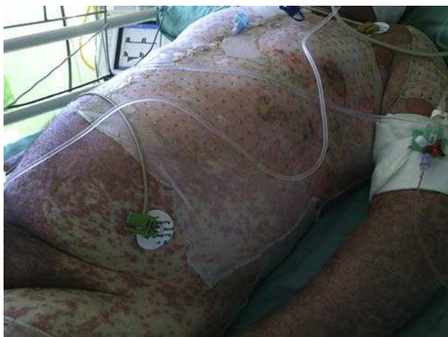
Figura 1 Se aprecia una erupción generalizada consistente en máculas eritematosas con tendencia a la confluencia, ampollas flácidas y áreas erosionadas cubiertas por Biobrane®

En el estudio radiológico al ingreso se observaban los hiliros engrosados y adenopatías hiliares y parahiliares. No se