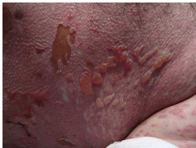
Figura 2 En esta imagen a mayor aumento, se aprecian grandes ampollas superficiales y áreas de necrosis.

apreciaban imágenes de consolidación. Los datos analíticos más relevantes fueron una PCR de 86, tiempo de protrombina del 60,5% y un INR de 1,25. Se realizó una biopsia que reveló una epidermis con necrosis confluyente extensa y despegamiento a nivel subepidérmico. La dermis superior presentaba un infiltrado linfoplasmocitario de predominio perivascular (fig. 3). Con estos datos el paciente fue diagnosticado de necrólisis epidérmica tóxica por vemurafenib, con un SCORTEN de 3. A su llegada, se suspendió el vemurafenib y se inició tratamiento con ciclosporina a dosis de 75 mg cada 12 h por vía intravenosa así como descontaminación digestiva selectiva, aporte vitamínico y nutricional, y sueroterapia. Las áreas de piel necrosadas fueron retira-