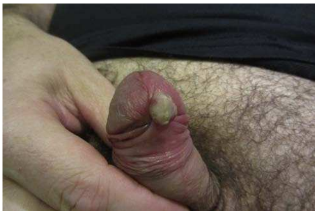
Figura 1 Tumor rosado, de superficie queratósica y pediculado en el surco balanoprepucial.

El estudio histopatológico mostró una proliferación de células fusiformes atípicas de núcleo alargado, citoplasma