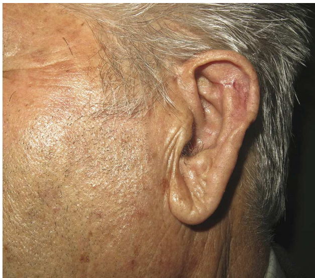
Figura 2 Resultado postoperatorio a los 3 meses de la intervención quirúrgica.

realizar triángulos de Burow en un solo tiempo, con buenos resultados estéticos (fig. 2) 4 .