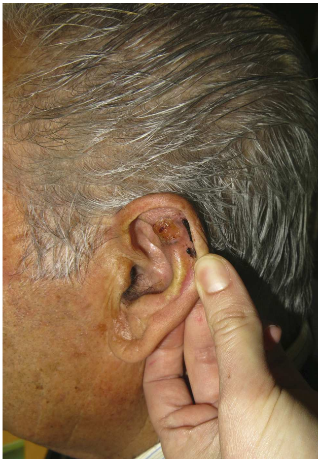
Figura 1 Carcinoma basocelular adenoide ulcerado de 1,8 × 1,5 cm de diámetro.