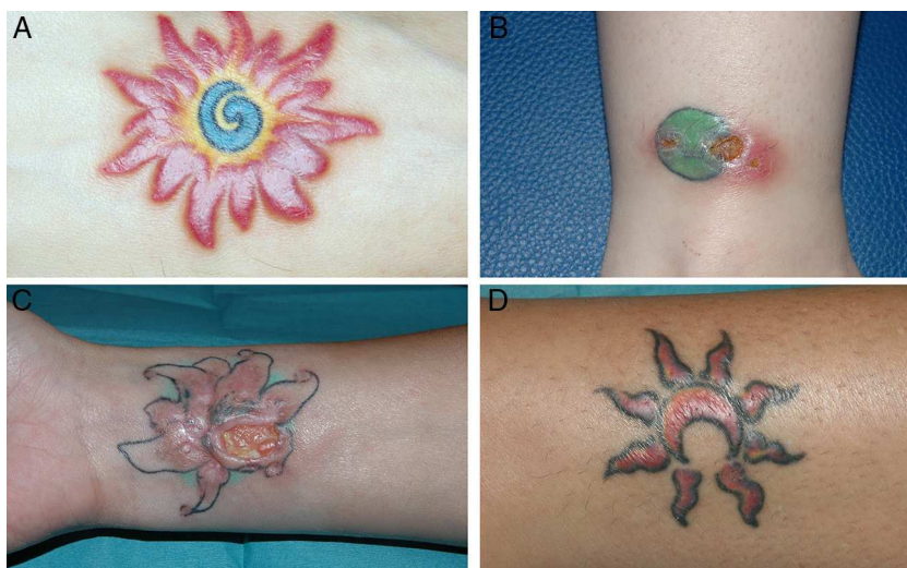
Figura 1 A. Lesión número 1 con inflamación de las áreas rojas de un tatuaje multicolor. B. Lesión número 3 con ulceración e inflamación coincidiendo con el color rojo de un tatuaje verde y rojo. C. Lesión número 4 que muestra una úlcera de gran tamaño en las zonas rojas de un tatuaje verde, rojo y negro. D. Lesión número 5 con inflamación del área roja de un tatuaje, iniciada 5 meses después de presentarse la lesión número 4 en la misma paciente.

Las reacciones adversas cutáneas por hipersensibilidad a los tatuajes no son infrecuentes, y se atribuyen a los materiales que son inyectados. El color que con más frecuencia se asocia a reacciones adversas es el rojo. Tradicionalmente, los tatuajes rojos se confeccionaban a base de derivados del mercurio, y posteriormente del cadmio, que actualmente no están autorizados dada su toxicidad 3,4 . Actualmente se utilizan pigmentos sintéticos orgánicos, que conllevan un menor riesgo de reacciones adversas. El problema yace en que no existe una reglamentación estricta sobre el contenido de los pigmentos, y la mayor parte de los tatuadores profesionales desconocen la composición de estos 1 . Las personas a las que se les practica un tatuaje son, en su mayoría, desconocedoras de las sustancias que