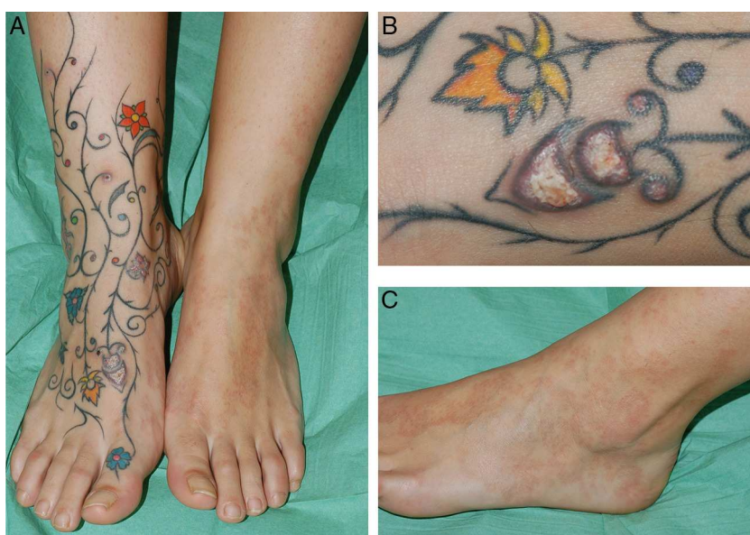
Figura 2 Lesión número 2 (A), mostrando erosiones y salida de material en las zonas rojas de un tatuaje multicolor en el dorso del pie derecho (B), mientras que en dorso del pie izquierdo se observan lesiones de granuloma anular (C).

Los patrones histológicos que se producen a consecuencia de una reacción adversa a un tatuaje son diversos, siendo el más frecuente el patrón liquenoide. Otros tipos de reacciones a tatuajes son las de tipo eczematoso, pseudolinfomatoso, esclerodermiforme, colagenosis perforantes y, como en nuestros casos, granulomatoso 6 .