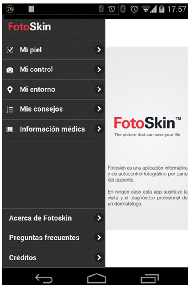
Figura 1 Diseño general de la aplicación para smartphones «FotoSkin®».

La aplicación se ha diseñado para smartphones y tablets , dispositivos que presentan importantes ventajas frente al ordenador fijo 9 : la facilidad de uso, la rapidez en la toma de fotografías y almacenamiento, el recordatorio de los autocontroles mediante notificaciones y, especialmente, la portabilidad (el paciente llevará sus imágenes consigo cuando acuda a las revisiones con el dermatólogo). FotoSkin® es de descarga y uso gratuito, disponible tanto para el sistema operativo IOS® (iPhone, iPad) como para Android®.