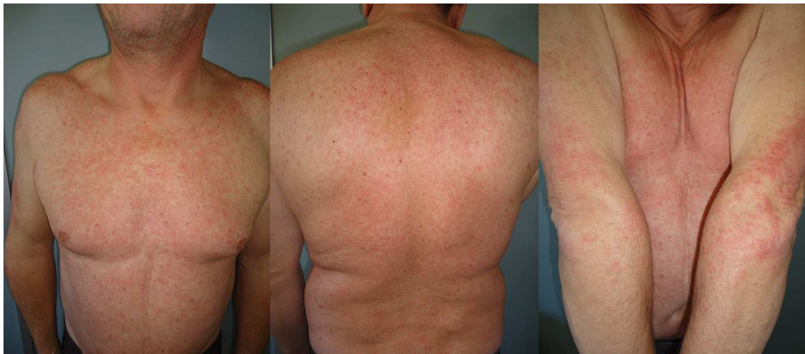
Figura 1 Erupción papular eritematosa, escasamente descamativa, compatible clínicamente con un eccema (caso 1).

CT: glucocorticoides tópicos; F: femenino; M: masculino; SCA: superficie corporal afectada; VHB: virus de la hepatitis B; VIH: virus de la inmunodeficiencia humana.