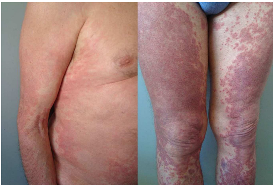
Figura 2 Lesiones maculares, confluentes, que se volvían más purpúricas en los miembros inferiores (caso 2).

Consumo establece unos criterios restrictivos para su uso 5 . En los ensayos clínicos con telaprevir se ha podido comprobar que la incidencia de rash y fotosensibilidad llega a ser superior al 50% y además es dosis dependiente. El diagnóstico es eminentemente clínico, y no hemos encontrado descrita la realización de pruebas complementarias en la literatura. Roujeau et al. 6 subrayan las diferencias con las «toxicodermias» clásicas, indicando que afectan a un gran número de pacientes, aparecen más tardíamente, de días a semanas tras la introducción del fármaco, y se resuelven también de forma más lenta. Ellos describen una media de 44 días hasta la resolución, pero con un rango que llega a los 504 días. En nuestra serie algunos pacientes han tenido un seguimiento que ha llegado a los 12 meses, y ocasionalmente han requerido la readministración de corticoides orales. Pensamos que la persistencia de la dermatitis, incluso la aparición de nuevos brotes podría deberse al efecto del IFN y la ribavirina, que se siguen administrando tras finalizar de la pauta con telaprevir. De hecho, 2 pacientes (11 y 12) consultaron por primera vez tras terminar la pauta con telaprevir, y aunque las lesiones se iniciaron con este la consulta se debía principalmente a la persistencia de las lesiones, atribuible en parte al uso de IFN y ribavirina.