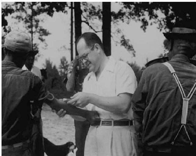
Figura 2 Exploración en el estudio de Tuskegee. Fuente: National Archives.