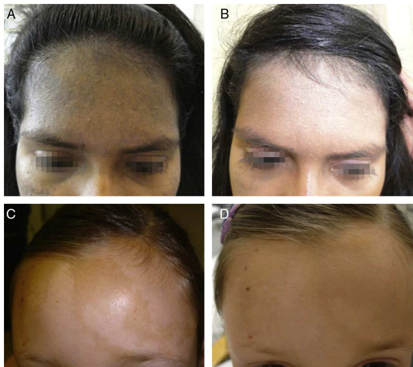
Figura 1 A y B. Nevus de Ota bilateral antes y después de la sesión de maquillaje corrector. C y D. Hipomelanosis de Ito antes y después de la sesión de maquillaje corrector.