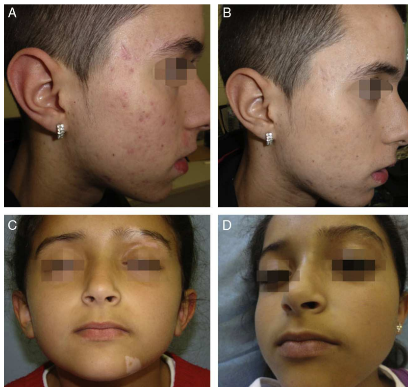
Figura 2 A y B. Cicatrices postacné antes y después de la sesión de maquillaje corrector. C y D. Vitiligo segmentario antes y después de la sesión de maquillaje corrector.