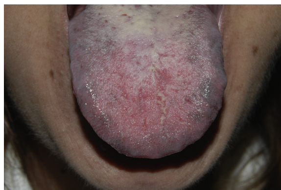
Figura 1 Pigmentación gris-azulada de la lengua, predominantemente en las áreas laterales del dorso lingual.

después del inicio en abril de 2011 de la segunda tanda de tratamiento con alfa-interferón pegilado y ribavirina, la paciente presentó sensación de quemazón en la lengua y observó la aparición de pigmentación en la mucosa oral y la mucosa genital. A la exploración presentaba máculas pigmentadas gris-azuladas localizadas predominantemente en las áreas laterales del dorso de la lengua (fig. 1). Presentaba también pigmentación en ambas mucosas yugales (fig. 2) y lesiones similares a nivel de la mucosa vulvar. La paciente no mostraba lesiones hiperpigmentadas cutáneas, y en ese momento no tenía sintomatología sistémica. No fue preciso retirar el tratamiento y las lesiones perma-