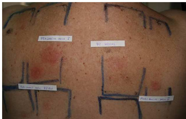
Figura 2 Con la introducción de nuevos marcadores de alergia a fragancias no solo encontramos nuevos casos, sino que mejoramos el diagnóstico de los pacientes ya sensibilizados.

Cuando uno o 2 de los marcadores de fragancias sean positivos en la batería estándar (MF I, BP o ambos) se recomienda testar la serie específica de fragancias, aunque se ha visto que es de menor rentabilidad si solo se ha obtenido un resultado positivo para el BP, ya que en el 75% de los casos no obtendremos ningún resultado positivo a una fragancia específica.