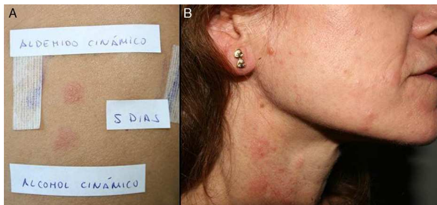
Figura 1 Dermatitis en la cara lateral de cuello, zona frecuente de afectación de dermatitis alérgica de contacto por fragancias por aplicación de perfumes y colonias. En el caso de esta paciente estaba sensibilizada a aldehído y alcohol cinámico.

menos 100 tienen probada capacidad alérgica 30 . Afortunadamente, un número limitado de ellas producen la mayor parte de las sensibilizaciones en la población, facilitando así la detección de pacientes alérgicos mediante pruebas epicutáneas, testando un pequeño número de fragancias asociadas en mezclas.