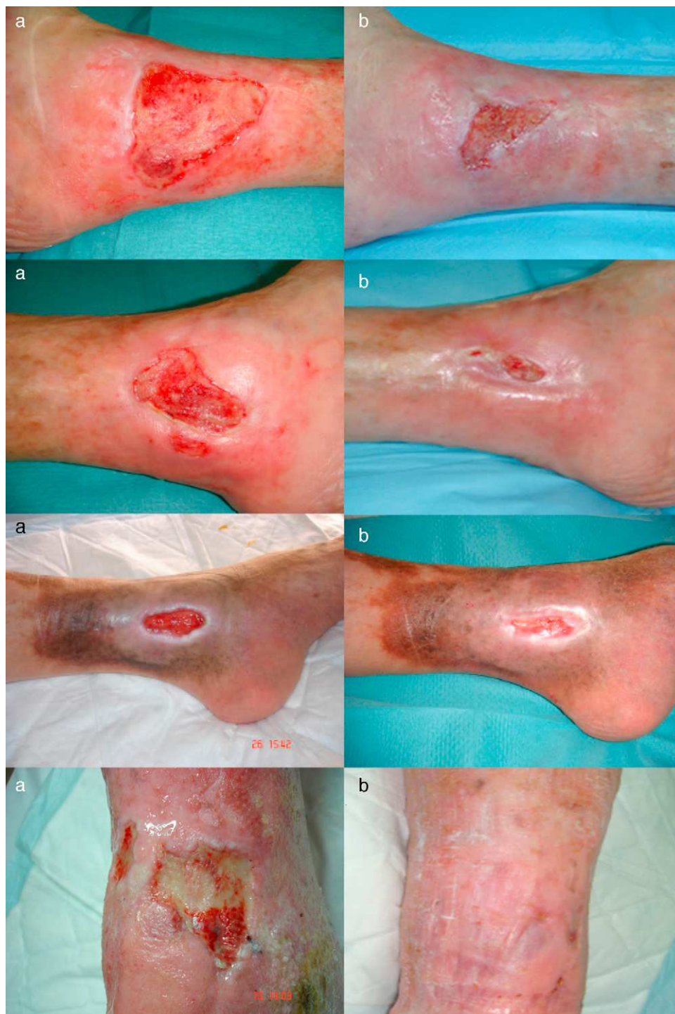
Figura 1 Área de las lesiones. A.Semana 0. B.Semana 16.