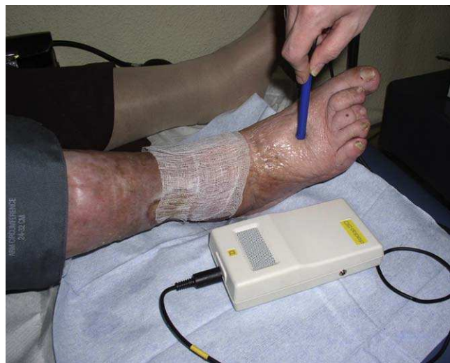
Figura 6 Realización mediante doppler de mano del IPTB. IPTB: índice de presión tobillo-brazo.

Debe realizarse en todos los pacientes, mediante el uso de un doppler de mano (fig. 6). Sin detallar toda la técnica, consiste en obtener la presión sistólica en la arteria peroneal posterior y dividirla por la de la arteria radial. Si es o mayor a 1 se considera normal, y podemos realizar terapia compresiva si es una úlcera de origen venoso; si es menor