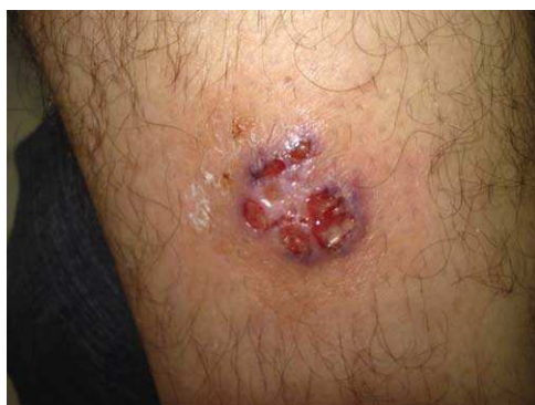
Figura 2 Pioderma gangrenoso.

úlceras de origen venoso o arterial. Las úlceras venosas empeoran en aquellas circunstancias que aumentan la presión venosa, como la bipedestación estática, y se alivian con las que la disminuyen, como la deambulacion, reposo con elevación o terapia compresiva. El dolor arterial aparece en reposo o durante deambulacion.