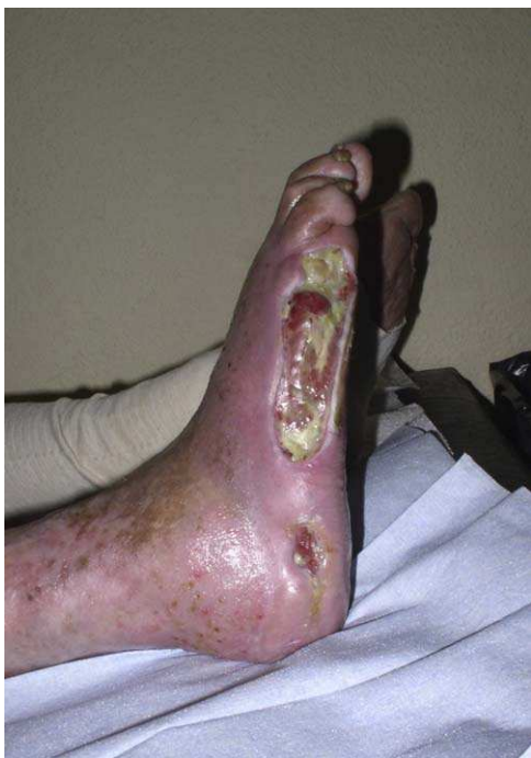
Figura 5 Úlcera de aspecto arterial.

sugestivo de carcinoma, ampoloso, sugestivo de pioderma gangrenoso, etc.), presencia de tejido no viable (necrosis), cantidad y calidad del exudado, presencia o no de tejido de granulación, y, por último, su tamaño.