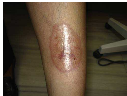
Figura 3 Placa de necrobiosis lipóidica con ulceración inicial.

úlceras de origen venoso o arterial. Las úlceras venosas empeoran en aquellas circunstancias que aumentan la presión venosa, como la bipedestación estática, y se alivian con las que la disminuyen, como la deambulacion, reposo con elevación o terapia compresiva. El dolor arterial aparece en reposo o durante deambulacion.