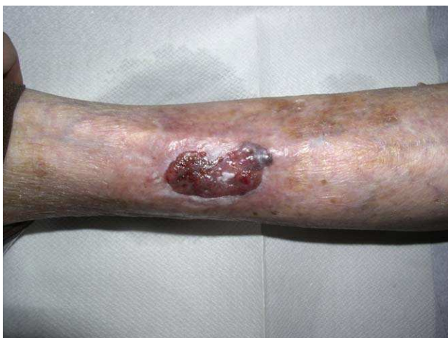
Figura 1 Lesión tumoral ulcerada remitida como úlcera crónica, correspondiente a un carcinoma basocelular.