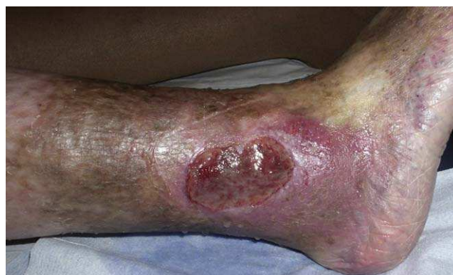
Figura 4 Úlcera de aspecto típicamente venoso.