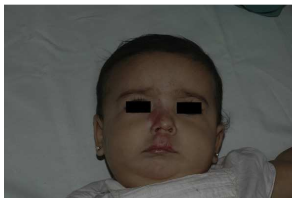
Figura 2 La paciente tras 5 meses y medio de tratamiento (7 meses y medio de vida).

puesta completa fue del 66,6%, la parcial del 30,5%, y se mantuvieron estables un 2,7% de los HI tratados ( figs. 1-4 ). La evolución de esta respuesta según la edad de los pacientes, menores o mayores de 12 meses, se muestra en la figura 5 . Las diferencias de respuesta encontradas entre mayores o menores de 6 meses y mayores o menores de