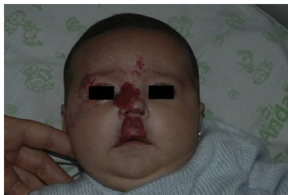
Figura 1 Hemangioma infantil segmentario en regiones S1, S2 y S4 en niña de 2 meses de vida. Se apreciaba importante deformidad en columela nasal y filtrum labial. El estudio complementario descartó síndrome PHACE.

Tras un mes de tratamiento un 6,1% de todos los HI presentó respuesta completa y un 94,4% respuesta parcial. A los tres meses el 27,7% presentó respuesta completa y el 66,6% respuesta parcial. En este momento dos pacientes con senos hemangiomas requirieron un aumento de la dosis de 2 a 4 mg/kg/día por estabilización o crecimiento de la lesión, con gran deformidad. A los 6 meses de tratamiento la res-