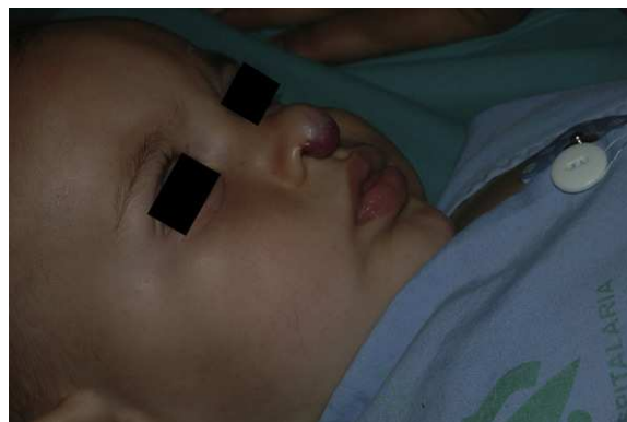
Figura 3 Hemangioma infantil en punta nasal en un niño de 9 meses de vida. Recibió a esa edad una infiltración local de corticoides. A la edad de 18 meses inició tratamiento con propranolol oral por persistencia de la lesión, que mantuvo durante 7 meses.

puesta completa fue del 66,6%, la parcial del 30,5%, y se mantuvieron estables un 2,7% de los HI tratados ( figs. 1-4 ). La evolución de esta respuesta según la edad de los pacientes, menores o mayores de 12 meses, se muestra en la figura 5 . Las diferencias de respuesta encontradas entre mayores o menores de 6 meses y mayores o menores de