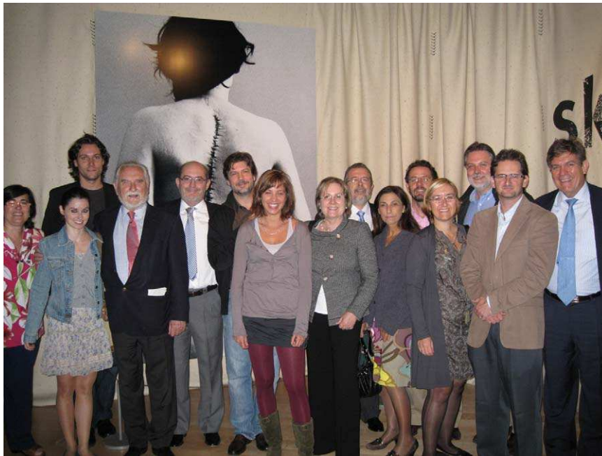
Figura 2 Miembros de la AEDV en la visita a la Exposición SKIN. Londres 2010.