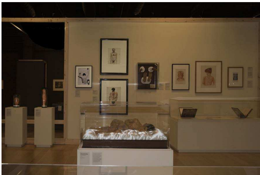
Figura 3 Vista de una sala de la Exposición SKIN. Londres 2010.

La fotografía aún no ha logrado conseguir el impacto de realidad que contienen estas figuras en tres dimensiones, donde además de verse el color, pueden apreciarse los relieves y las texturas de las lesiones de la piel, que la cera, por su plasticidad, imita a la perfección. De hecho, actualmente, en algunos países como EE.UU. y Alemania, donde la tecnología médica está muy avanzada, se ha vuelto otra vez a los orígenes, creando nuevos modelados, esta vez con materiales más modernos y utilizados incluso