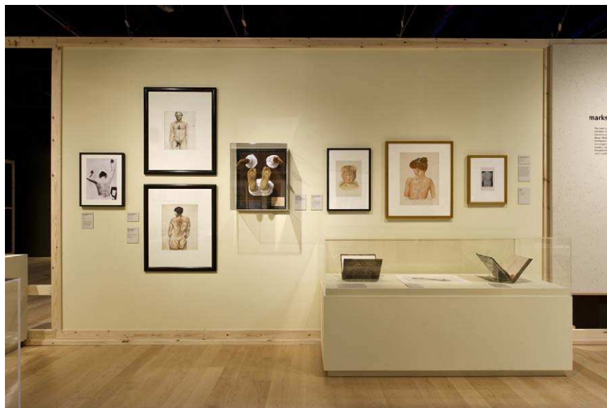
Figura 4 Vista de una sala de la Exposición SKIN. Londres 2010.

en medicina, como por ejemplo el alginato, resinas y las siliconas.