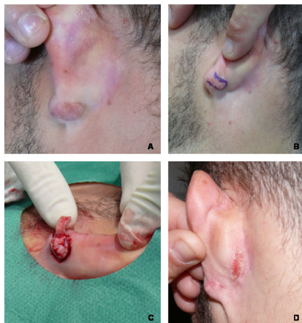
Figura 2 Detalle de la técnica quirúrgica y evolución hacia recidiva parcial (paciente 9). A) Aspecto preoperatorio del queloide y delimitación del colgajo a utilizar. B) Aspecto del «colgajo en filete». C) Resultado de la técnica en el postoperatorio inmediato. D) Recidiva parcial a los 5 meses de seguimiento.