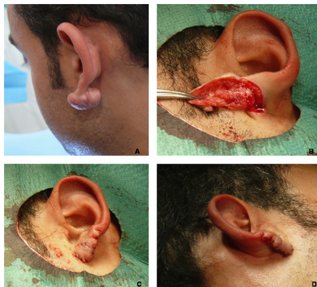
Figura 1 Detalle de la técnica quirúrgica (paciente 2). A) Aspecto preoperatorio del queloide. B) Colgajo obtenido tras la disección del núcleo del queloide. C) y D) Resultado en el postoperatorio inmediato.