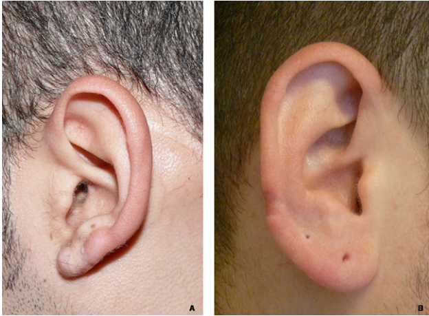
Figura 3 A) Detalle de la evolución del paciente 2 tras 25 meses de la realización del colgajo en filete. B) Detalle de la evolución del paciente 10 tras 12 meses de la realización del colgajo en filete.

pacientes alcanzó un rango de 12–28 meses (media de seguimiento de 18,2 meses). En 4 de los 10 pacientes no ha aparecido recidiva hasta el momento del envío de este manuscrito (fig. 3). Dos pacientes presentaron necrosis