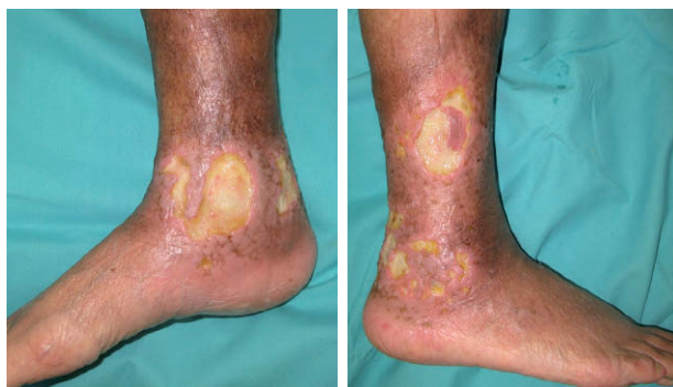
Figura 1. Úlceras dolorosas bien delimitadas localizadas en la región perimaleolar derecha.

Una vez establecido el origen del proceso ulcerativo crónico se planteó la retirada de HU. Durante el intervalo de tiempo en el que se mantuvo HU hasta su suspensión se