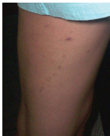
Figura 1. Topografía lineal de las lesiones.

En 1896 Unna acuñó el término «espiradenoma» para describir un adenoma benigno de la glándula sudorípara derivado del ovillo secretor, contraponiéndose al de