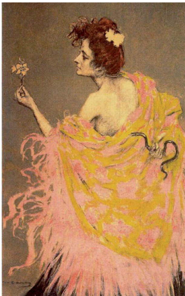
Figura 4. «Sífilis», de Ramón Casas.