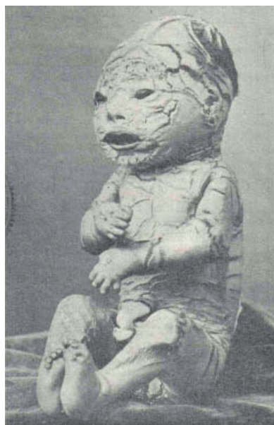
Figura 1. Caso clínico.

Las manos y los pies presentaban los dedos cilindroides, afilados y la porción ungueal reforzada por un estuche córneo que cubría la uña...» (fig. 1).