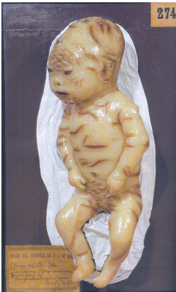
Figura 2. Molde de cera.

En el molde 274 de la colección del Museo del hospital San Juan de Dios 2 encontramos una representación bastante aproximada del caso de esta paciente (fig. 2).