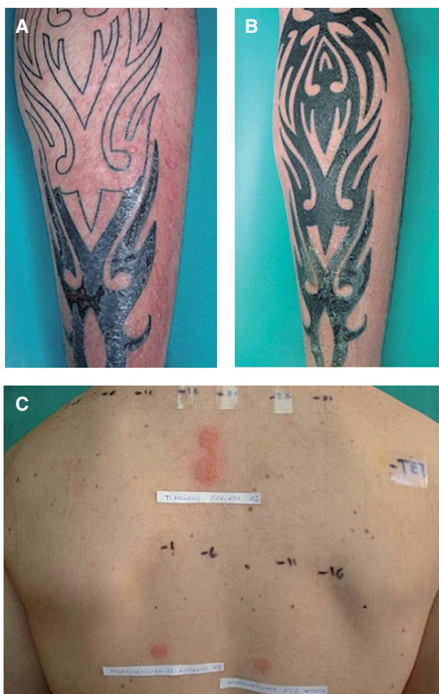
Figura 1. A. Eccema que desborda el tatuaje localizado en la pantorrilla izquierda. Las lesiones comenzaron tras una semana de uso de Terra Cortril® pomada. B. Eccema tras completar la parte superior del tatuaje. La clínica comenzó a los dos días tras la aplicación de la pomada. C. Positividad de las pruebas epicutáneas para el tixocortol pivalato, hidrocortisona e hidrocortisona-17-butilato.

ron pruebas epicutáneas con la batería estándar del Grupo Español de Investigación en Dermatitis y Alergia Cutánea (GEIDAC), que mostró positividad para el tixocortol pivalato (+++D2, +++D4, +++D7), nuestra serie de corticoides (tabla 1) que fue positiva para hidrocortisona 2,5 alc (++D2, +++D4, +++D7) e hidrocortisona-17-butilato (++D2, +++D4, +++D7) (fig. 1C) y un parche con tetraciclina al 5% en vaselina que fue negativo.