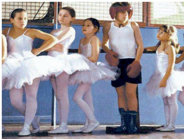
Póster de la película Billy Elliot.

Cuando me acerqué a ella, yo ya sabía que estaba compuesta de la materia que se cuece en mil estrellas;