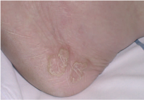
Fig. 1.—Lesiones anulares de 2,5 cm de diámetro con borde hiperqueratósico y elevado, localizadas en cara lateral externa del pie izquierdo.