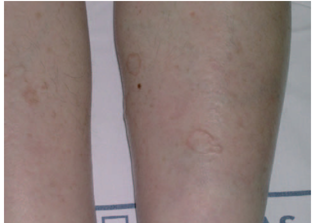
Fig. 2.—Lesiones de poroqueratosis en zona pretibial de ambas piernas.