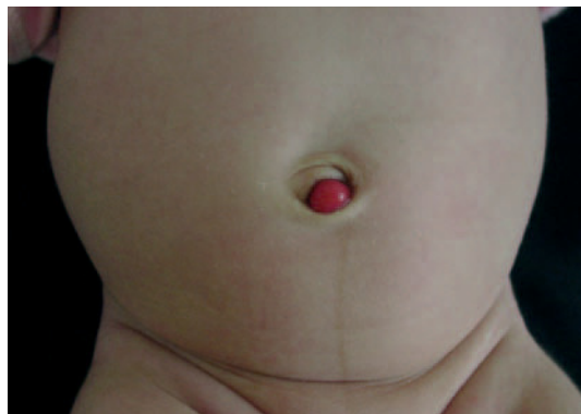
Fig. 1.—Neoformación hemiesférica localizada en la región umbilical.