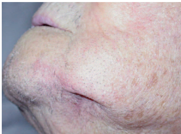
Fig. 1.—Depresión cutánea con signos inflamatorios locales en la zona submandibular izquierda.