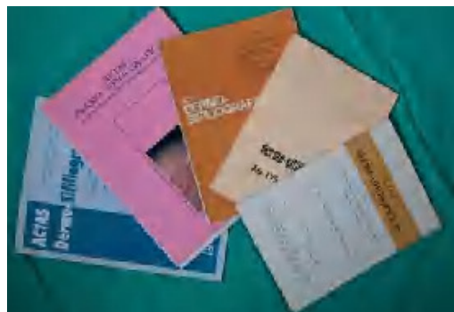
Fig. 8.—Diversas portadas de la revista Actas durante su historia.