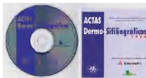
Fig. 11.—La publicación de un volumen completo de Actas Dermo-Sifiliográficas en disco compacto tuvo lugar en 1998 por primera vez —se repitió también en 1999—.