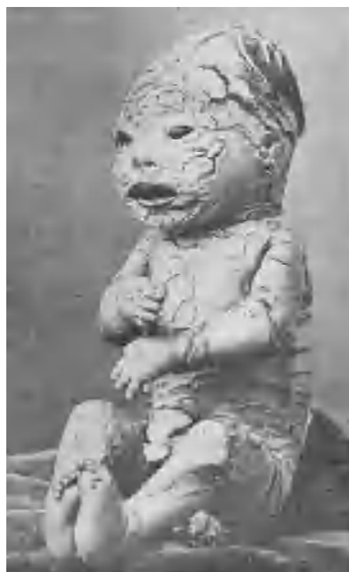
Fig. 4.—Esta curiosa imagen es el primer fotograbado publicado en Actas Dermo-Sifiliográficas . Figura insertado en el texto de un artículo de Azúa titulado Hiperkeratosis (sic) universal congénita maligna. (Ictiosis fetal; queratoma maligno congénito, etc.), en la página 78 del número 2 de julio de 1909. La descripción clínica de Azúa no es menos enjundiosa que la imagen: «...Toda la piel dura, rígida, resistente, inestensible (sic); la capa córnea parecía cuero, cortado en muchas partes por extensas y profundas grietas, de fondo sangriento. Las tales grietas formaban alrededor del ano, vulva y boca radiaciones que recordaban las lesiones fisurarias de los heredo-sifilíticos...»

El primer número de Actas corresponde a los meses de mayo-junio de 1909 y el segundo número a julio de 1909. A partir de éste la revista se publicó por cursos lectivos de octubre-noviembre a junio-julio. En los primeros años aparecían cinco números por curso (bimestral, descansando agosto-septiembre). A partir de 1928, pasaron a ser nueve números (mensual de octubre a junio). En la cabecera de cada ejemplar se indicaba el año y el número. Esto crea cierta confusión en