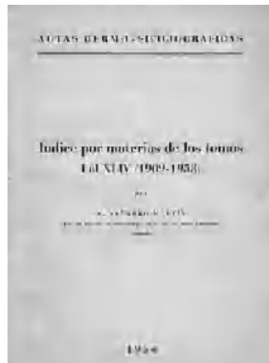
Fig. 7.—En 1954 se celebraron los 50 años de existencia de la Academia y de Actas . Además de los actos de celebración (una misa por los académicos fallecidos, una sesión científica y una cena de confraternización —ya entonces ofrecida por la industria farmacéutica—) se decidió la publicación de este libro-índice de los primeros 50 años de la revista.