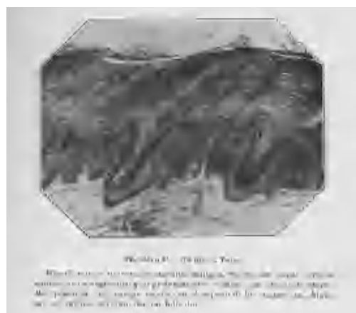
Fig. 5.—Este fotograbado histológico ilustra el caso clínico de la figura anterior. Aparece junto a otra fotomicrografía de un prurigo en una lámina de papel cuché sin número de página entre las páginas 90 y 91 del mencionado número 2 de julio de 1909. Azúa describe en el pie de imagen: «...las capas córneas enormemente engrosadas y las prolongaciones córneas, que, a modo de estaquillas, penetran en el cuerpo mucoso en el espesor de los pezones malpighianos ó siguiendo el infundíbulo folicular.»