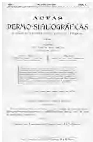
Fig. 1.—Portada del primer número de Actas Dermo-Sifiliográficas de mayo de 1909. Aparece también en reproducción facsimilar en la propia revista en la celebración del 75 aniversario en el primer número del año 1984, de donde se ha tomado esta imagen, ya que en las colecciones de Actas que hemos manejado, los números de la revista están encuadrados sin las portadas.

El propio nombre de Actas Dermo-Sifiliográficas no es casual, ya que inicialmente se publicaban en ella tan