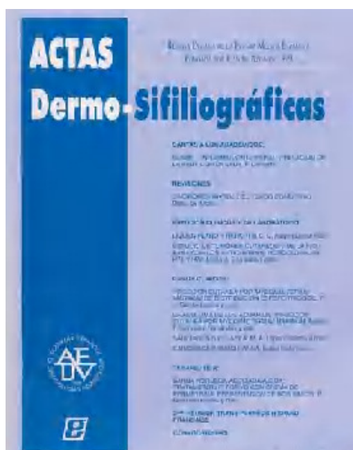
Fig. 10.—El diseño de la portada actual data de 1995, poco después de que Evaristo Sánchez Yus y Luis Requena se hicieran cargo de la revista. La recuperación del nivel editorial y del prestigio internacional de Actas Dermo-Sifiliográficas fue una de las principales preocupaciones del entonces presidente de la Academia, Francisco Camacho, quien encargó a Yus y Requena la reactivación y mejora de la revista para poder retornar a las más importantes bases de datos internacionales.