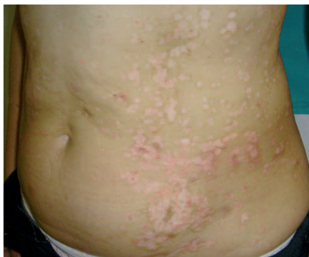
Fig. 2.—Máculas hipopigmentadas con refuerzo periférico hiperpigmentado ligeramente descamativas y confluyentes en el tronco.