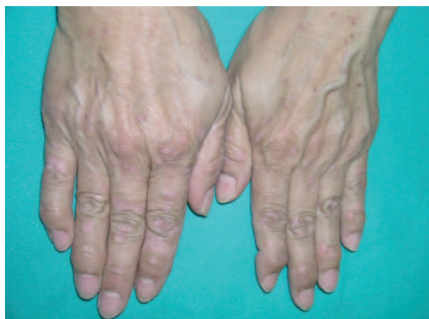
Fig. 1.—Múltiples verrugas planas en el dorso de las manos.