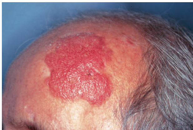
Fig. 1.—Placa eritematosa violácea de gran tamaño en zona fronto-temporal izquierda.

b Servicio de Anatomía Patológica. Hospital Universitario de La Princesa. Madrid. España.