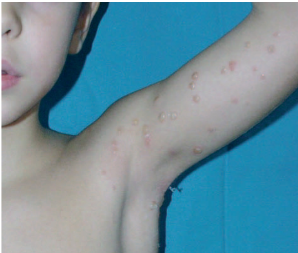
Fig. 2.—Vesiculación de las lesiones de molusco contagioso tras la aplicación de cantaridina.