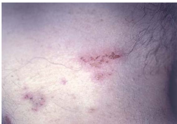
Fig. 1.—Placas eritematosas erosionadas localizadas en las regiones axilares.

El hemograma y la bioquímica de rutina fueron normales. Se practicó una biopsia de una de las lesiones del cuello (figs. 3 y 4).