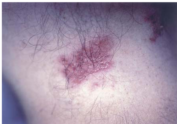
Fig. 2.—Placa eritematosa axilar con erosiones superficiales.