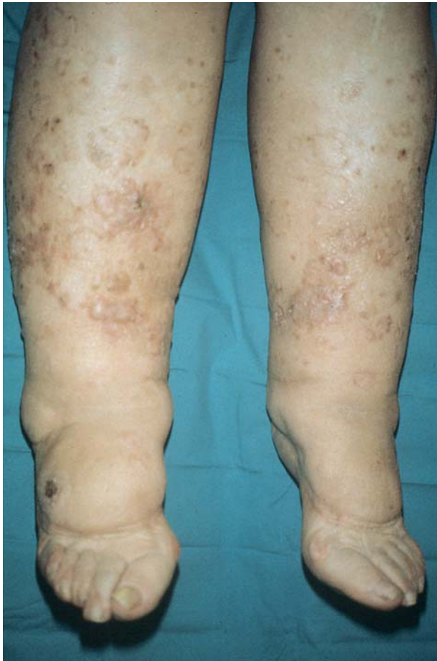
Fig. 1.—Linfedema crónico en fase III en ambas extremidades inferiores conjuntamente con múltiples pápulas hiperqueratósicas, redondeadas de pequeño tamaño discretamente hiperpigmentadas.

A la exploración física se observó una piel rugosa, áspera, con edema duro, sin fóvea e irreductible en ambas extremidades inferiores (linfedema crónico en fase III) conjuntamente con numerosas pápulas hiperqueratósicas, redondeadas de pequeño tamaño (1-3 mm de diámetro), discretamente hiperpigmentadas (fig. 1). Estas lesiones papulosas habían crecido adoptando un aspecto circinado de bordes netos, queratósicos, delimitados por un pequeño surco acanalado, dejando un centro atrófico de aproximadamente 1 a 3 cm de diámetro con coloración marronácea. Algunas de estas lesiones circinadas estaban ocupadas total o parcialmente por áreas hipertróficas con perfecta delimitación de la piel sana circundante, manteniendo un borde lesional de aspecto queratósico (fig. 2). En algunas áreas, principalmente en el tercio inferior, estas lesiones hipertróficas presentaban un componente vegetante y verrugoso de aspecto tumoral, de consistencia firme y