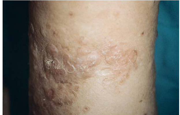
Fig. 2.—Áreas hipertróficas dentro de las lesiones circinadas que delimitan perfectamente la piel sana circundante y manteniendo en el borde lesional el aspecto típico de una poroqueratosis.