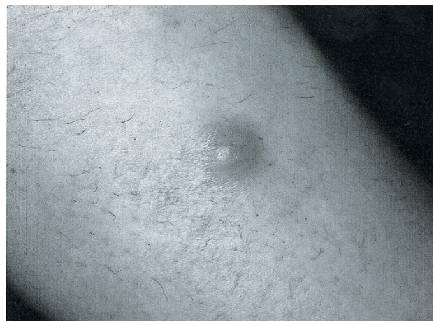
Fig. 1.—Nódulo eritematovioláceo en la cara interna de la rodilla derecha.

Se realizó la extirpación quirúrgica del nódulo y en la actualidad la paciente está asintomática.