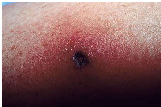
Fig. 1.—Lesión nodular eritematosa localizada en pierna con centro ulceronecrotico.

ria a la diseminación pulmonar. La paciente comenzó tratamiento pautado por el servicio de Hematología con anfotericina liposomal a la dosis de 5 mg/ kg/ día por vía intravenosa, obteniéndose clara mejoría, y se sustituyó después por voriconazol vía oral, triazol de reciente aparición, con resolución total del cuadro infeccioso, desaparición de las lesiones cutáneas y del nódulo pulmonar como se comprobó en las pruebas de imagen realizadas posteriormente.