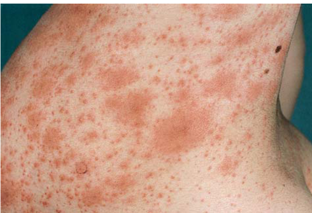
Fig. 6. Erupción polimorfa del embarazo. Lesiones urticariformes diseminadas.

La histopatología es inespecífica, apreciándose un infiltrado inflamatorio perivascular superficial linfocitario. El número de eosinófilos es variable y pueden ser abundantes 27 . Dependiendo del tipo de lesión clínica biopsiada y de la evolución de ésta se pueden apreciar áreas de espongirosis en las lesiones iniciales y acantosis con paraqueratosis en las más tardías. La inmunofluorescencia es consistentemente negativa 57 .