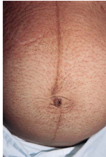
Fig. 7. Erupción polimorfa del embarazo. Lesiones de localización preferente perifolicular.

La patogenia de la enfermedad es desconocida, la localización de las lesiones en las estrías sugiere que el cuadro debiera tener relación con la distensión abdominal 58, 59 . Algunos autores han relacionado la presencia de EPE con existencia de embarazos múltiples 60 , ganancia de peso materno y ganancia de peso fetal, datos que corroborarían la hipótesis anterior. Aractingi et al 61 han encontrado presencia de ADN fetal en la epidermis de mujeres diagnosticadas de EPE; sin embargo, ellos mismos postulan la necesidad de realizar estudios más finos para comprobar el verdadero valor patogénico de este hecho. La desproporción en el sexo de los neonatos de las mujeres con EPE a favor de varones sugiere, asimismo, que pudiera haber factores hormonales maternos que influirían en el desencadenamiento del cuadro 9, 62 .