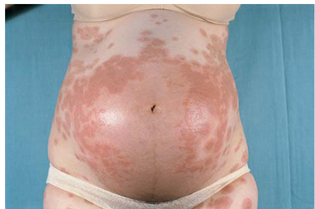
Fig. 1. Herpes gestationis . Lesiones en área abdominal de disposición preferente periumbilical.

La clínica consiste en la aparición de prurito exasperante, asociado a lesiones urticariformes o ampollas durante el segundo o tercer trimestre del embarazo. La localización preferente de las lesiones es el abdomen, a menudo alrededor o próximas al ombligo con posterior expansión al resto de la superficie corporal (fig. 1), la afectación de la cara es muy poco frecuente y la afectación mucosa se puede decir que inexistente. Las lesiones suelen progresar formando vesículas agrupadas y ampollas tensas (fig. 2). La evolución del cuadro y el grado de afectación son muy variables, normalmente hay una remisión parcial en la última parte de la gestación y una exacerbación en el momento del parto o inmediatamente después de éste 5, 8, 17 . En algunos casos hasta la resolución total del proceso se pueden presentar pequeños rebrotes premenstruales o en mitad del ciclo femenino 18 . Recurre en el 95% de los embarazos posteriores 17, 19 , siendo entonces la afectación más precoz y más intensa. No se ha podido determinar por qué en un 5% de los embarazos sucesivos no se desarrolla el cuadro. La enfermedad se reproduce tras la toma de anticon-