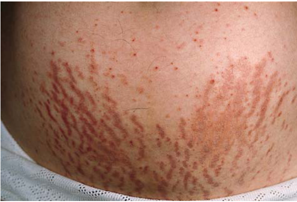
Fig. 5. Erupción polimorfa del embarazo. Lesiones dispuestas preferentemente en las estrías de distensión.

El cuadro se presenta habitualmente en primigestas durante el último trimestre del embarazo (preferentemente en el último mes) 52, 53 con lesiones muy pruriginosas. Las lesiones pueden ser papulosas de pocos milímetros de tamaño, localizadas preferentemente en las estrías (fig. 5), en placas urticariformes (fig. 6) o de disposición folicular (fig. 7), no siendo infrecuente que una misma paciente presente simultáneamente lesiones de distinto tipo 19, 54-56 . Ocasionalmente se pueden ver lesiones en diana y vesículas de pequeño tamaño 49 . La erupción es autolimitada, no presenta recurrencias en partos posteriores ni con la toma de anticonceptivos orales. El pronóstico materno y fetal es bueno, y es curioso con respecto al sexo de los neonatos que los hombres duplican a las mujeres 9 .