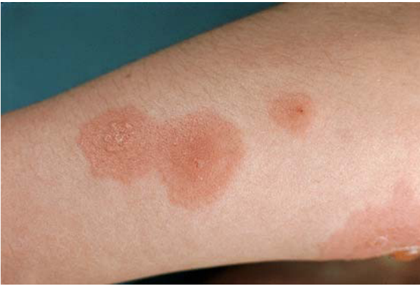
Fig. 2. Herpes gestationis . Lesiones urticariformes y ampollosas confluentes.

ceptivos orales con contenido estrogénico en el 10% de las pacientes, no habiéndose descrito ningún caso de aparición espontánea por la toma de anticonceptivos sin que se haya presentado la erupción en un embarazo previo 18, 20 .