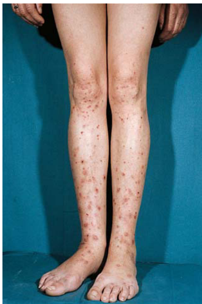
Fig. 8. Prúrigo del embarazo: lesiones escoriadas en extremidades inferiores.

minadas (fig. 8). No se ha encontrado un incremento en el riesgo fetal ni materno. La frecuencia de aparición descrita es variable ya que muchos cuadros diagnosticados como eccema se pudieran catalogar como PE 9 . Roger et al 7 estiman una frecuencia de aparición de 1 en 450 embarazos. La histopatología es inespecífica, predominando los fenómenos propios del rascado. La inmunofluorescencia siempre es negativa.