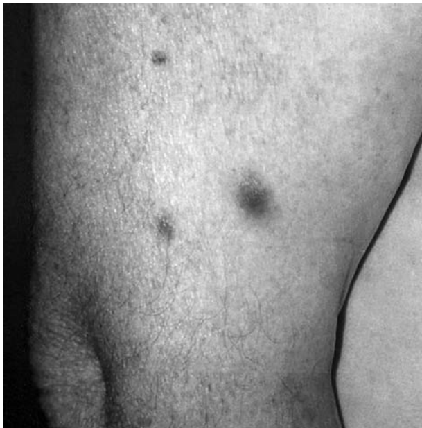
Fig. 1.—Lesiones nodulares, eritematosas, mal delimitadas, de centro necrótico en brazo.

Se añadió itraconazol al tratamiento previo con anfotericina B, sin mejoría e incluso con aparición de nuevas lesiones.