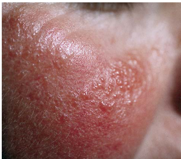
FIG. 2.—Caso 2. Lesiones de milium coloide sobre base eritematosa en la mejilla.

El milium coloide es una degeneración elastótica ligada a un exceso de exposición solar. El origen del