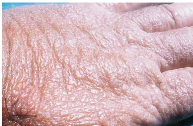
FIG. 1.—Caso 1. Pápulas amarillentas traslúcidas en dorso de mano derecha.

puestas en conjunto a ambos lados del dorso nasal sobre base eritematosa (fig. 2). Sufría daño solar actínico marcado con profundas arrugas de expresión, era de fototipo III, con pelo negro y ojos castaños. La exploración por órganos y aparatos estaba dentro de la normalidad.