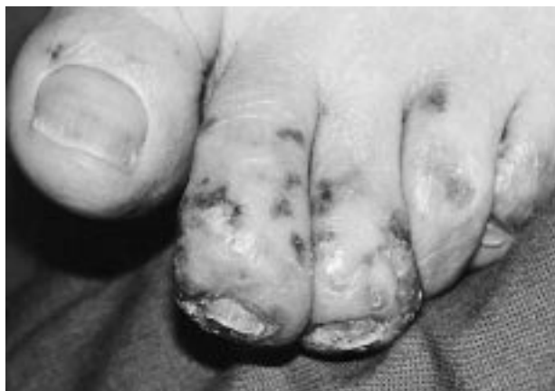
FIG. 2.—Aspecto clínico de las lesiones localizadas en pies.

Los hallazgos de laboratorio más significativos al ingreso fueron: leucocitos, 1.600/ \mu l (4,2-10,7); linfocitos, 1.200/ \mu l (1,4- 2,9), y neutrófilos, 100/ \mu l (2,1-4,9), estando los hematíes y las plaquetas dentro de