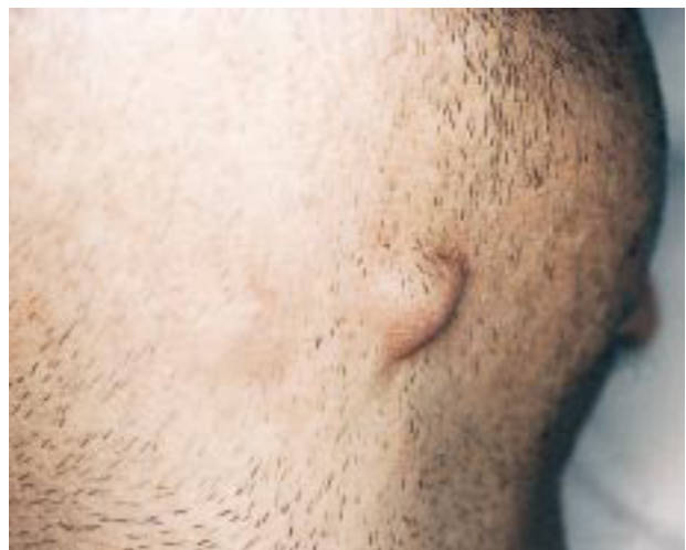
FIG. 1.—Nódulos de aproximadamente 1 cm de diámetro, de superficie lisa, localizados en área submentoniana.

En la exploración se observaba nódulos asintomáticos, de 1 cm de diámetro, de superficie lisa, bien delimitados, no adheridos a planos profundos. Se localizaban en área submentoniana y regiones preauriculares, con distribución simétrica (Fig. 1). No existía