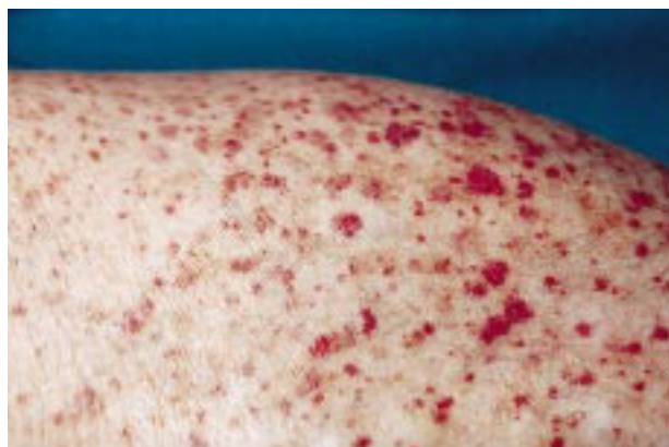
FIG. 1.—Elementos purpúricos en superficie anterior de muslo izquierdo.

tiovioláceas, redondeadas, no confluentes, que no desaparecían a la vitropresión (Fig. 1). En los exámenes de laboratorio destacaba: VSG de 44 mm en la primera hora; glucosa, 132 mg/ dl; proteínas totales de 9,5 g/ dl; PCR, 14 mg/ l (<5 mg/ l), y resto de analítica, incluyendo batería de anticuerpos, normales. La inmunoelectroforesis de sangre mostró IgG, 2.891 mg/ dl (800-1.800); IgA, 912 mg/ dl (90-450); cadenas kappa, 508 g/ l (2-4,4), y lambda, de 327 g/ l (1,2-2,4). IgM e IgD normales. En orina las cadenas lambda fueron de 1 mg/ dl (0-0,8), IgG de 1 mg/ dl (0-0,8), si bien las cadenas kappa y la proteína de Bence Jones fueron negativas. En el mapa óseo se apreciaron signos de desmineralización, sin áreas líticas. La biopsia cutánea mostró un infiltrado perivascular de predominio neutrofílico y hematíes extravasados, pero sin signos de vasculitis. La inmunofluorescencia directa fue negativa. El estudio endocrinológico reveló un hipotiroidismo subclínico con un valor de TSH de