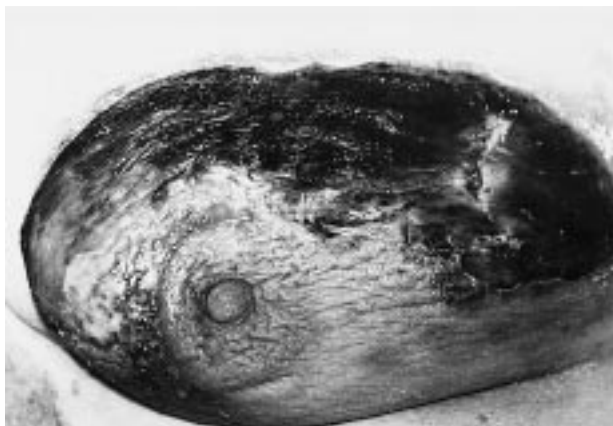
FIG.1.—Lesión a nivel de la mama derecha.

tación globular de 79 mm en la primera hora, glucemia de 242 mg/ ml y creatinina de 1,4 mg/ ml. Las serologías de lúes, hepatitis y VIH resultaron negativas, así como los proteinogramas en sangre y orina. La determinación de crioglobulinas y los estudios inmunológicos también arrojaron resultados negativos. El frotis de sangre periférica, el test de sangre oculta en heces y los estudios radiológicos y microbiológicos fueron normales.