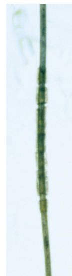
FIG. 5. Caso 2. Tallo piloso envuelto por varios segmentos de material no paraqueratósico.