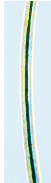
FIG. 2.—Caso 1. Tallo piloso envuelto completamente por un material cilíndrico.

tal, ya que se pueden encontrar hasta en el 61,6% de las niñas escolares del distrito chino de Chengdu (5).