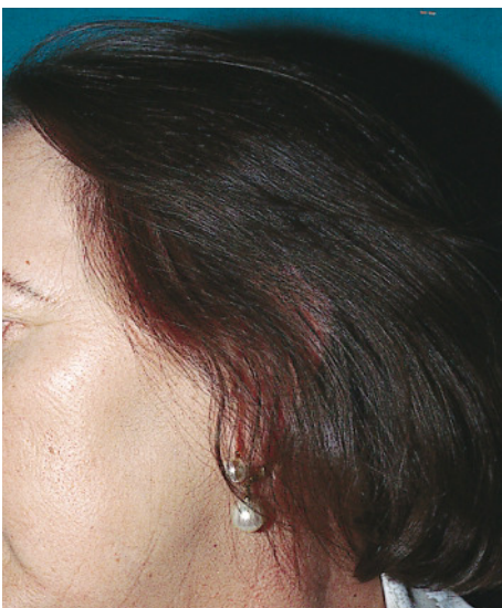
FIG. 3.—Caso 1. Cabello del color original al año de seguimiento

Estas vainas están compuestas por escamas paraqueratósicas. Es una queratina imperfecta o anormal que caracteriza a muchas dermatosis inflamatorias (6).