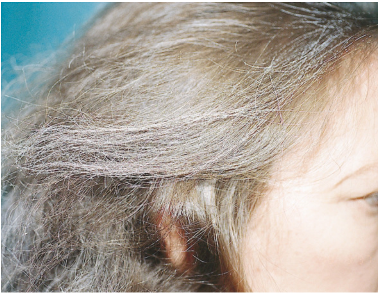
FIG. 1. Caso 1. Aspecto blanquecino difuso del cabello con persistencia del color de cejas y pestañas.