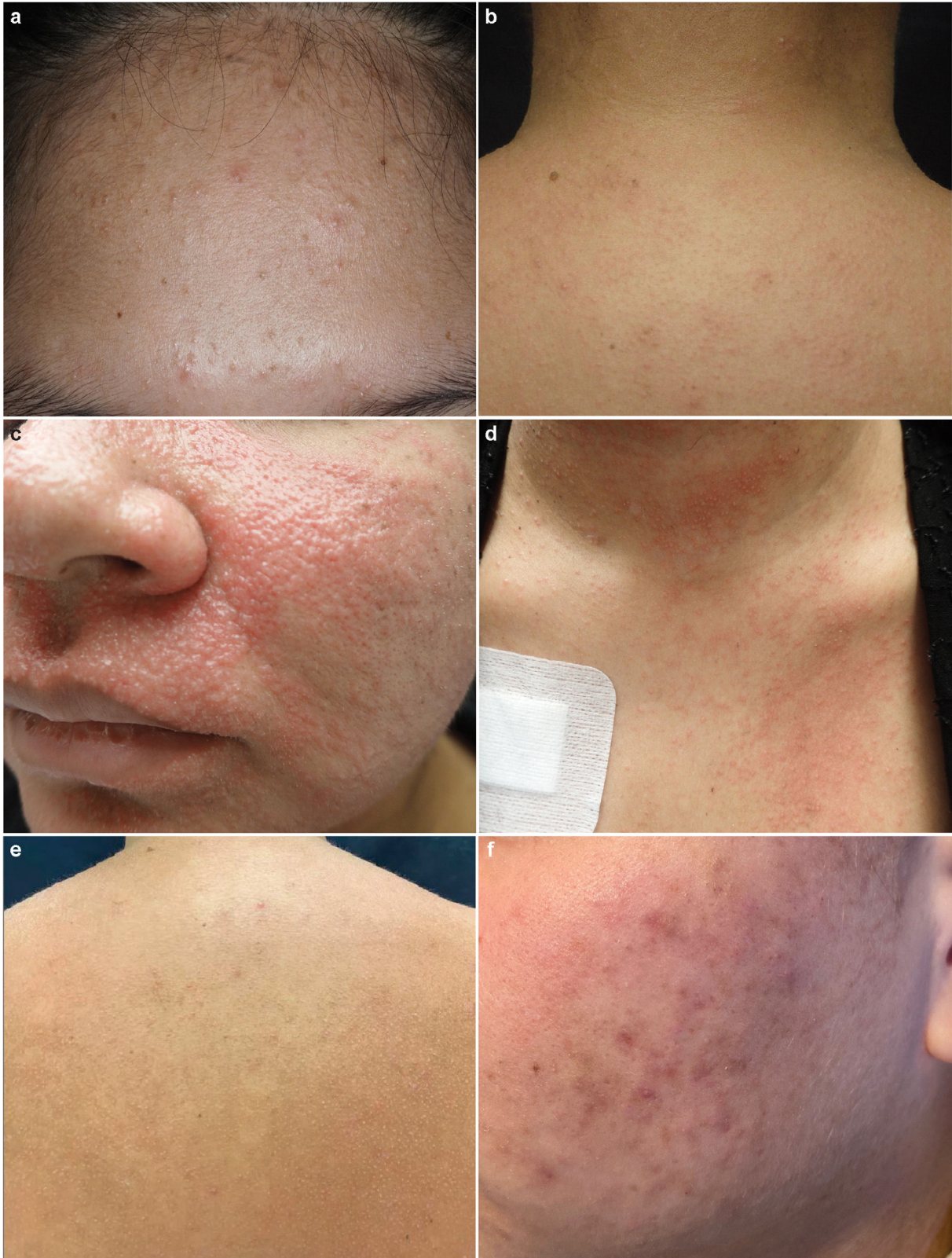
Figura 1 Presentación clínica de demodicosis en los pacientes 1 (a), 2 (b), 3 (c-e) y 4 (f). (a) Pequeñas lesiones pustulares en la frente. (b) Erupción maculopapular y pústulas en la parte superior de la espalda. (c) Exantema maculopapular confluyente que compromete las regiones perioral y malar. (d, e) Erupción maculopapular y micropústulas en tórax y espalda. (f) Pústulas y eritema malar.